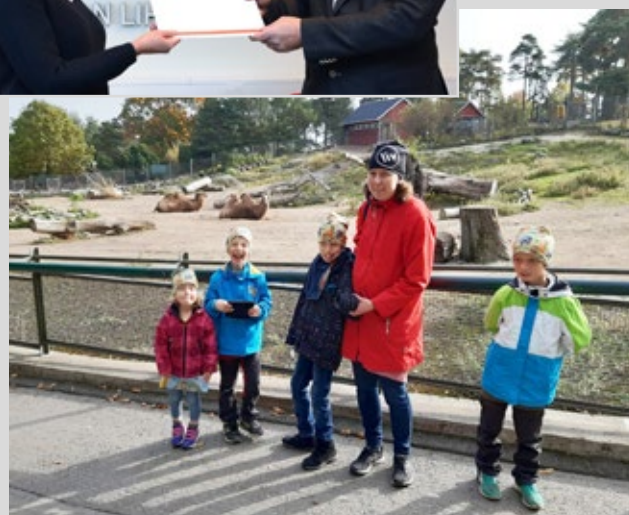
Familjen Ekfors fick drömdag vid Högholmens Zoo.